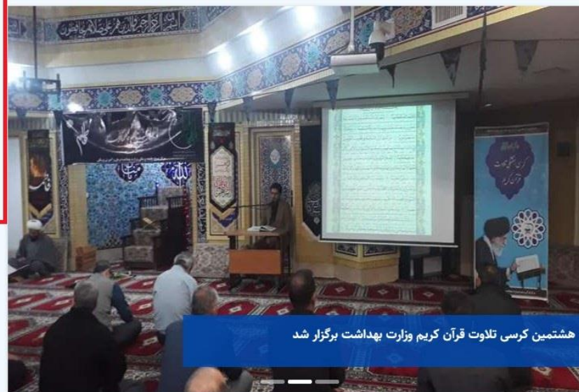
هشتمین کرسی تلاوت قرآن کریم وزارت بهداشت برگزار شد